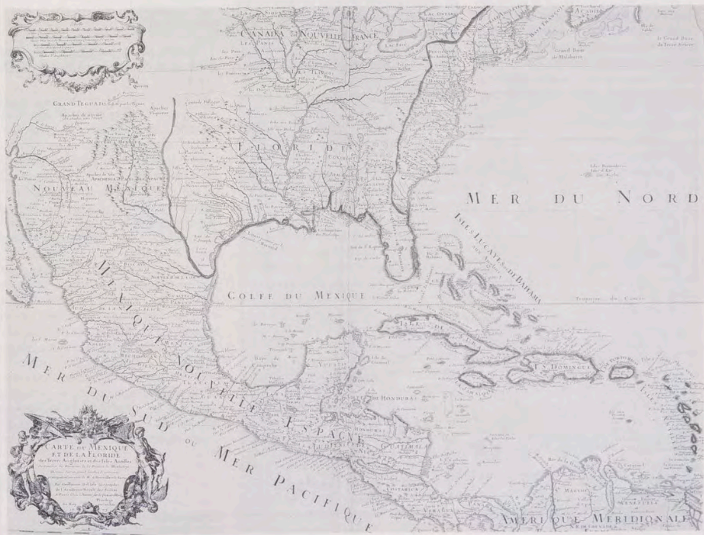
Nueva España (1703), según Del'Isle.

taria división del trabajo. Según dicha tesis, los reales de minas, en calidad de motores de arrastre, reclamaron alimentos y ganado de tiro en las regiones vecinas, por lo que se fue creando un cinturón de ranchos y haciendas abastecedoras de productos agropecuarios. Al mismo tiempo, el consumo de mantas —necesarias tanto para el abrigo de los trabajadores como para el transporte de los minerales— impulsó la formación de una red de centros textiles manu-