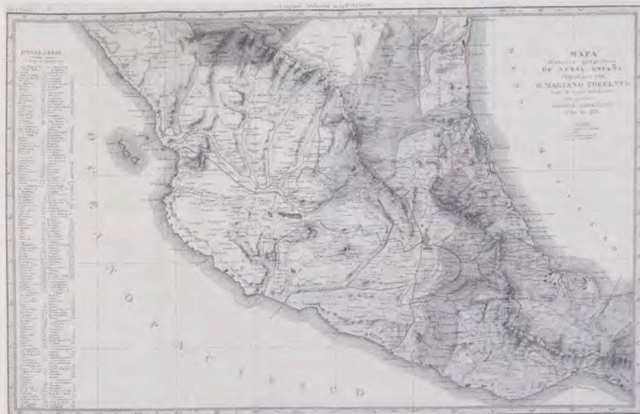
Regiones de la Nueva España (finales del siglo XVIII), según Mariano Torrente.

En resumen, la frontera minera siguió emigrando hacia el norte del virreinato, por lo que se dio una profunda transformación en los espacios colonizados. Zacatecas se transformó de centro minero en región ganadera, agrícola y núcleo manufacturero. La región de la meseta central, donde se concentraba la población peninsular y criolla, al mismo tiempo que se conservaba una importante densidad de población indígena, siguió girando, en términos generales, alrededor de la ciudad de México, en rápido crecimiento demográfico, que se comportaba como mercado