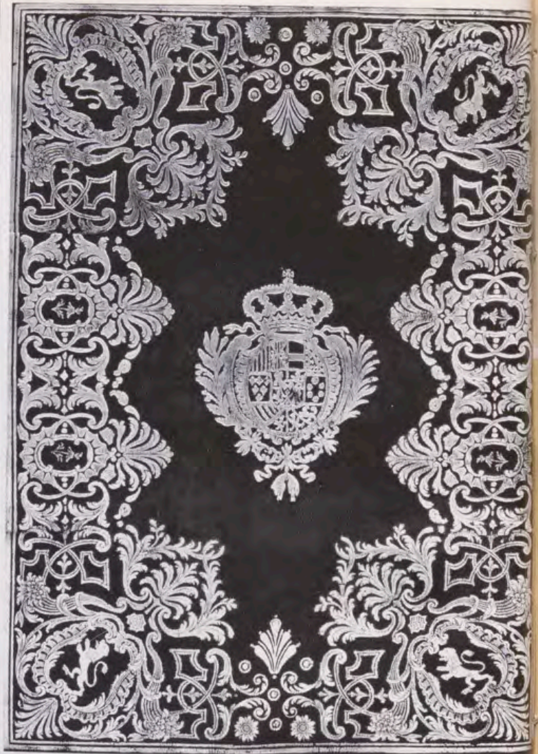
Encuadernación española rococó de la época de Carlos III, obra del taller madrileño de Antonio de Sancha. Pertenece a la «Oración de la Real Academia Española al Rey Nuestro Señor con motivo del Matrimonio del Serenísimo Príncipe de Asturias y la Serenísima Princesa de Parma D. a Luisa». Madrid, 1765.