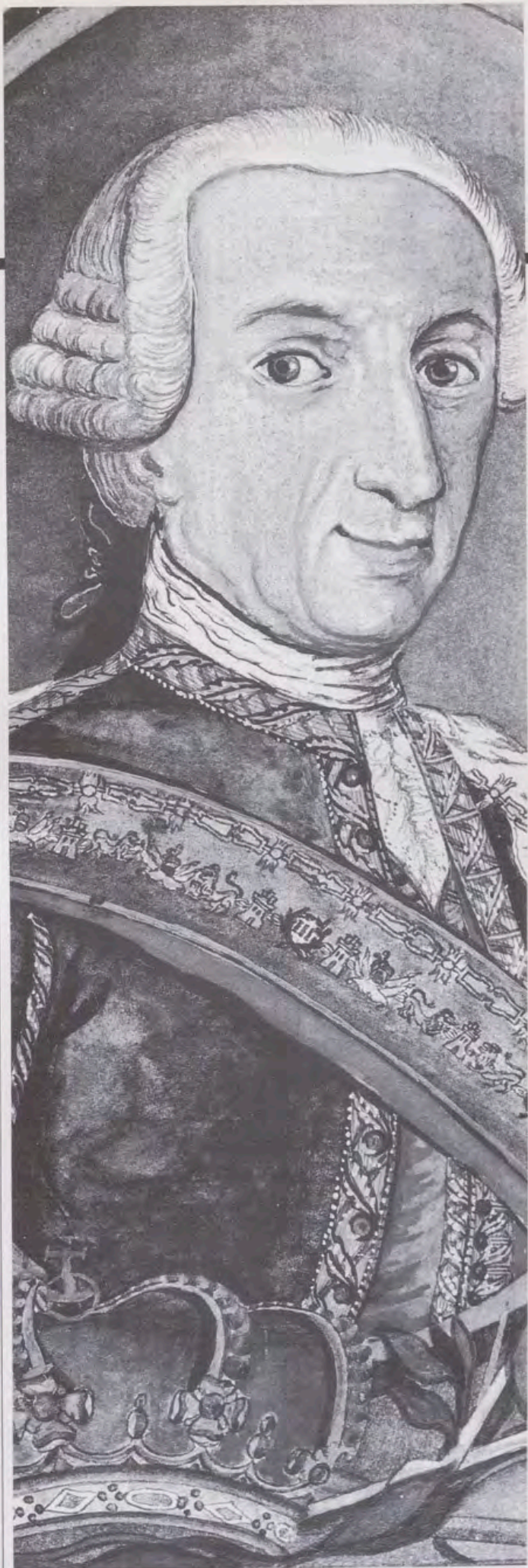
Retrato del Rey Carlos III, en la obra «Trujillo del Perú en el siglo XVIII», de Martínez Compañón.

Los Catálogos forman un conjunto de dos volúmenes, encuadernados en tafete rojo decorado con una bella orla floral dorada, de estilo rococó, obra del taller de Antonio de Sancha, «el más importante editor