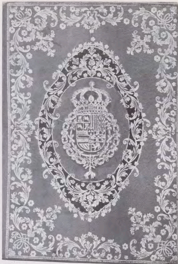
Encuadernación española rococó del Reinado de Fernando VI, obra del taller madrileño de Antonio de Sancha. Pertenecce a la obra de Pablo Roli «El Polifemo...». Madrid, 1748.