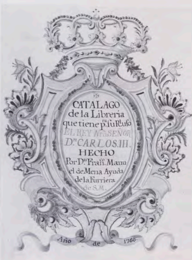
Portada del «Catálogo de la Librería que tiene para su Real uso el Rey Nuestro Señor Don Carlos III». Año de 1760.