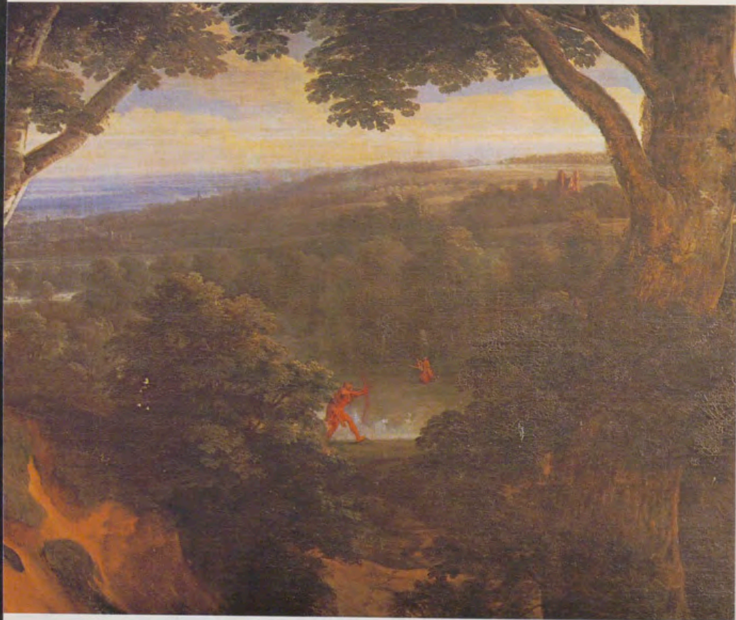
Detalle de «Hércules y Neso».