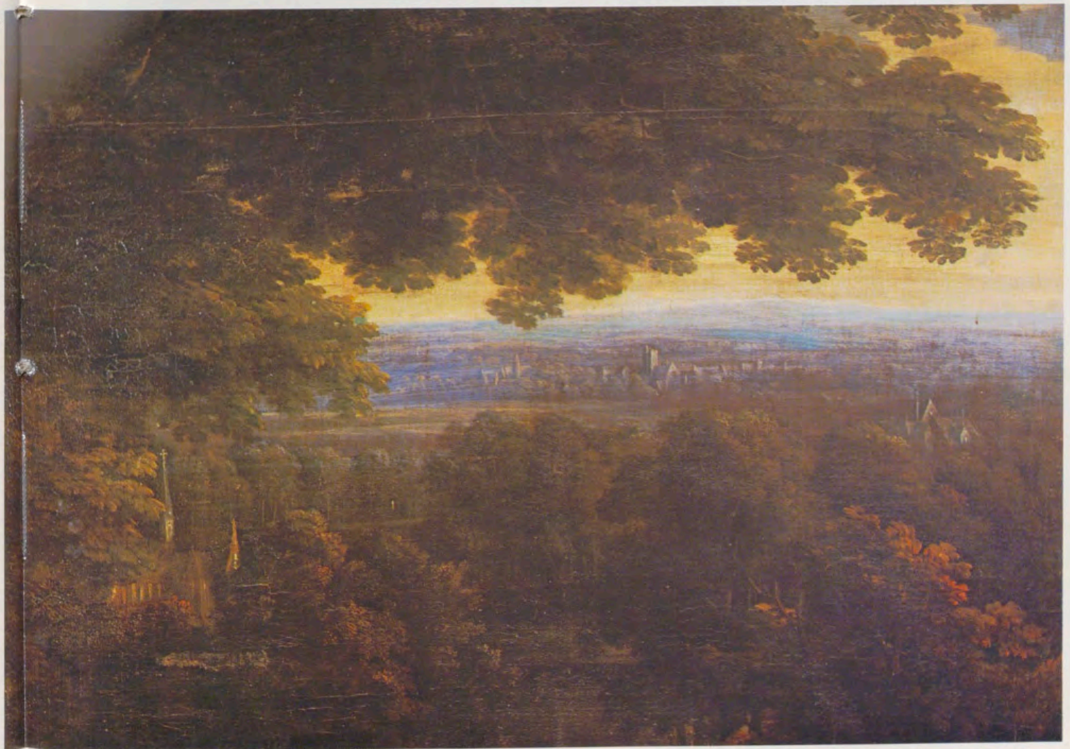
2. Detalle del «Paisaje: Mercurio y Herse», obra de Jacobus van Arthois.