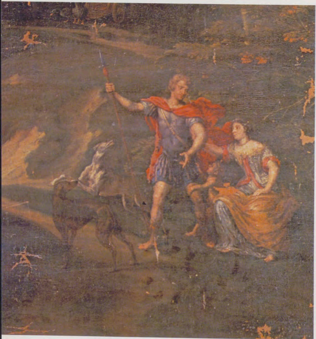
Detalle del «Paisaje: Venus y Adonis», obra de Jacobus van Arthois.

que las integraban 4 y detener el proceso de degradación a que estén sometidas. En este caso ya se ha iniciado el programa de consolidación y conservación de las obras aquí estudiadas.