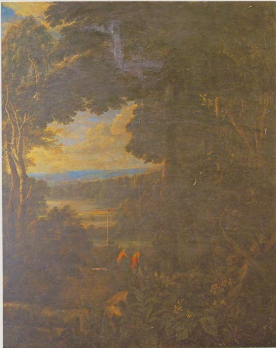
«Paisaje: Siringa y Pan» y detalle del mismo, obra de Jacobus van Arthois.