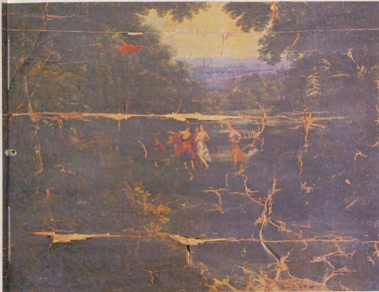
1 y 3. Dos detalles de «Júpiter y Calisto».