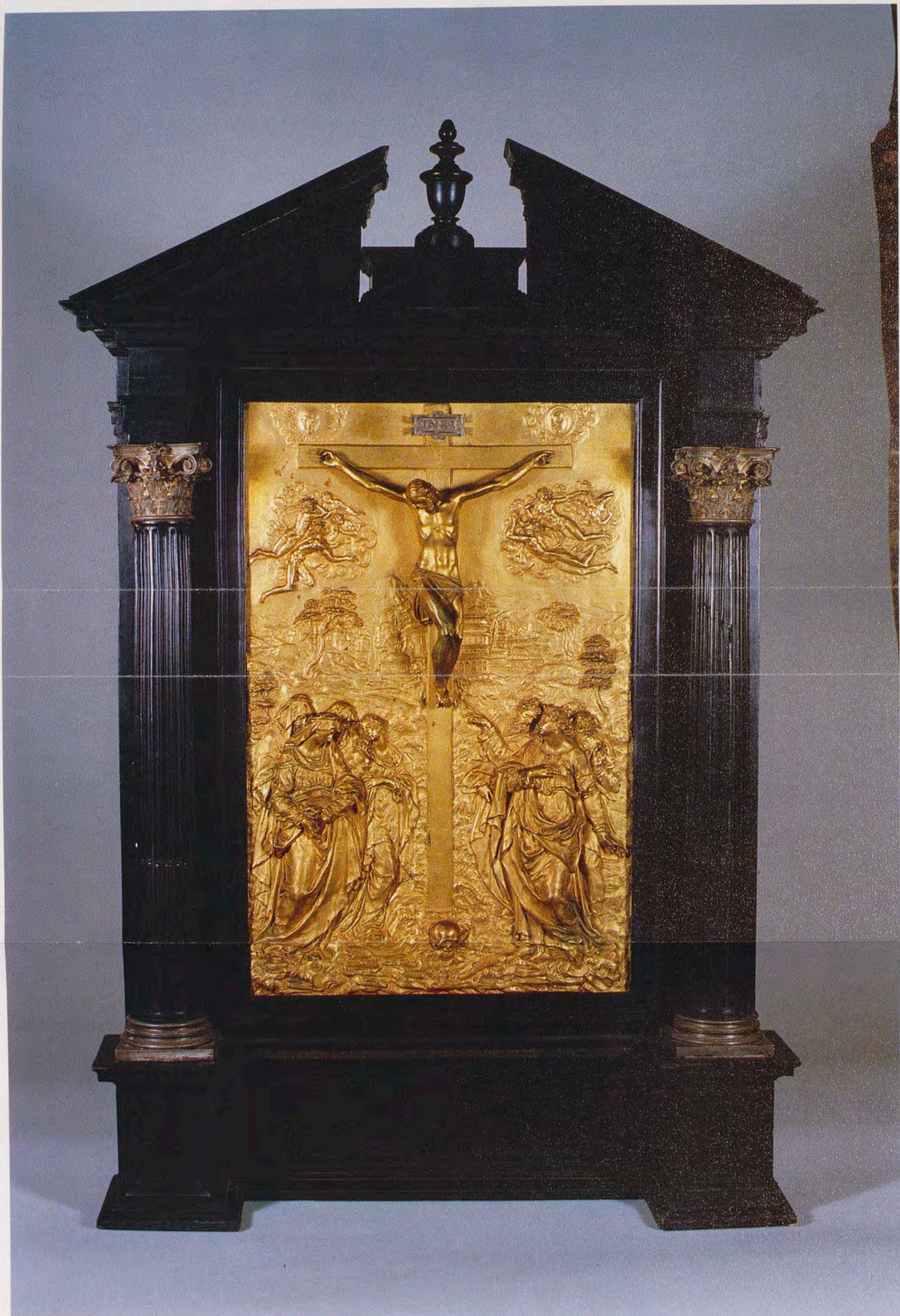
Relieve italiano donado a Felipe II en 1581 por la Duquesa de Toscana, Blanca Capello (Monasterio de El Escorial).