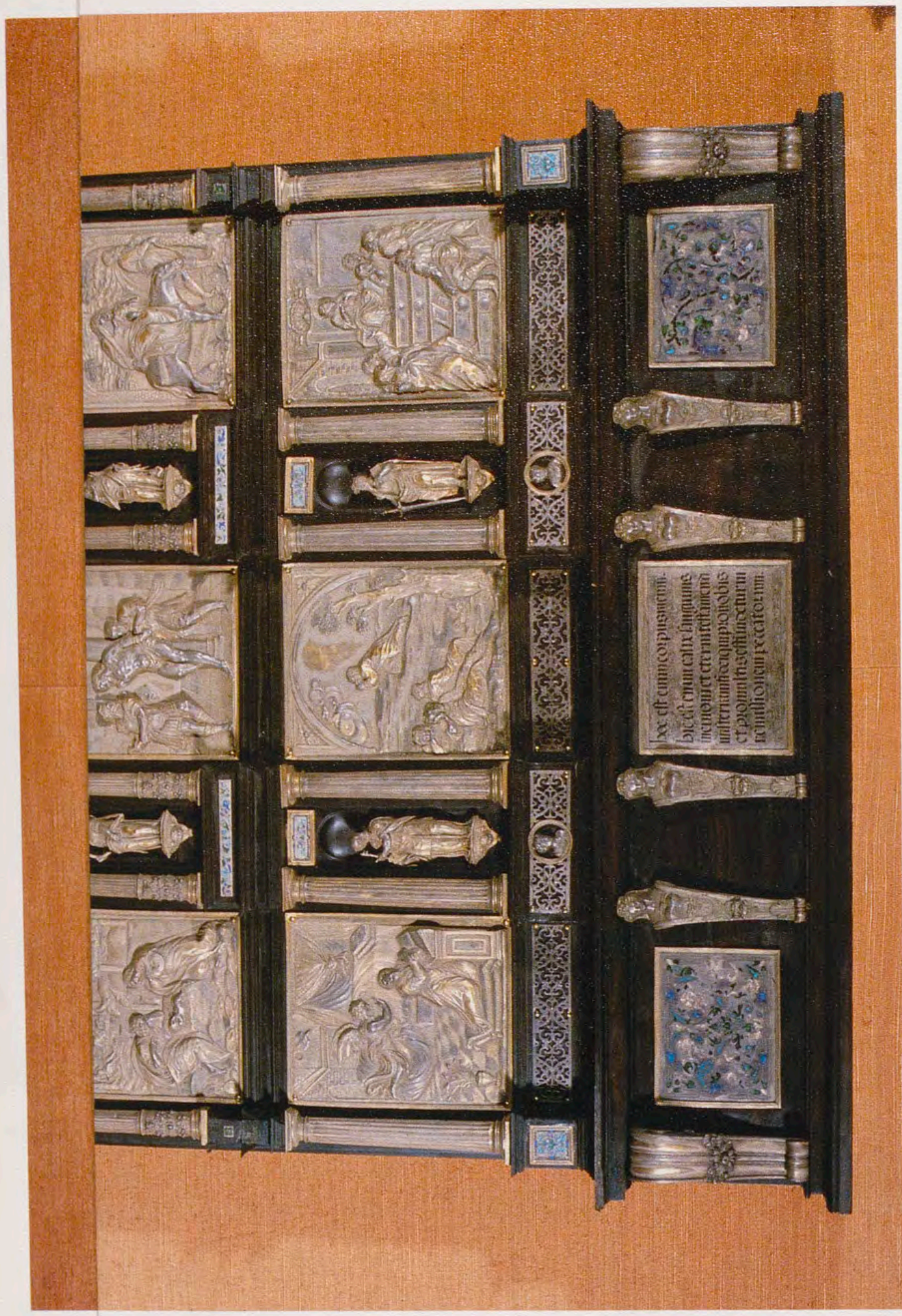
Altar portátil de Carlos V, donado al Monasterio de El Escorial por Felipe II en 1567.