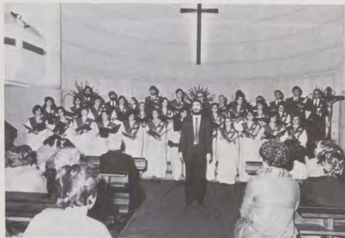
La Coral Santo Tomás de Aquino —a la izquierda— y el Grupo Neocantes —a la derecha— durante los conciertos que ofrecieron en la iglesia del Real Patronato del Buen Suceso.

el Sabio (1230-1284); Pierre Passereau (hacia 1509-1547), Alphonso Lobo (1555-1617), Francisco Guerrero (hacia 1528-1599), Thomas Weelkes (1576-1626) y Antonio Rodríguez de Hita (1724-1787).