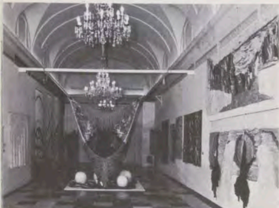
Vista general de uno de los Salones de Felipe II del Palacio Real de Aranjuez, donde tuvo lugar la exposición de tapices.

En el Palacio Real de Aranjuez se expusieron todos los tapices que participaron en el Premio Nacional del Tapiz que se celebró en esta localidad.