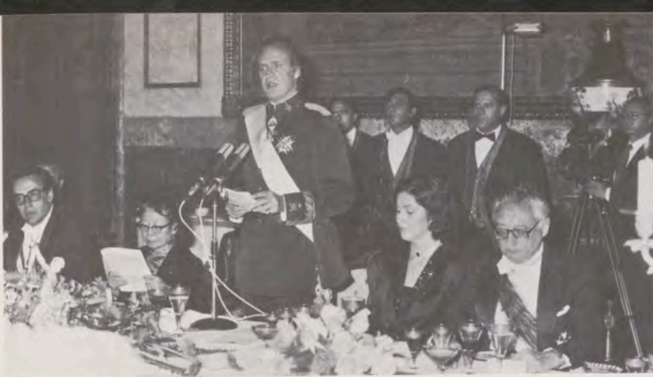
Su Majestad el Rey pronunció un discurso en la cena de gala ofrecida en honor del Presidente de China.