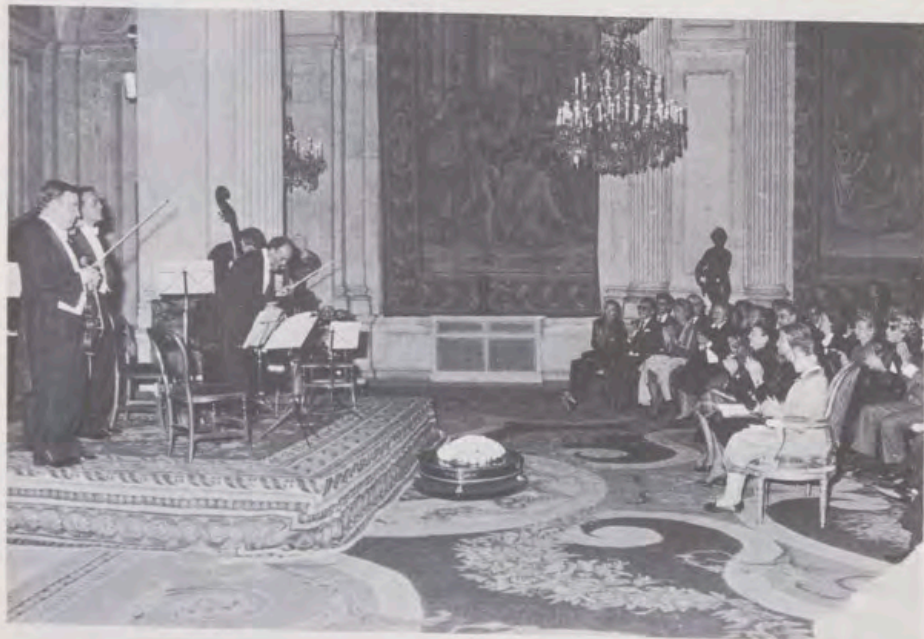
El Trío de Madrid, en un momento del concierto que ofreció en el Salón de Columnas del Palacio Real de Madrid.