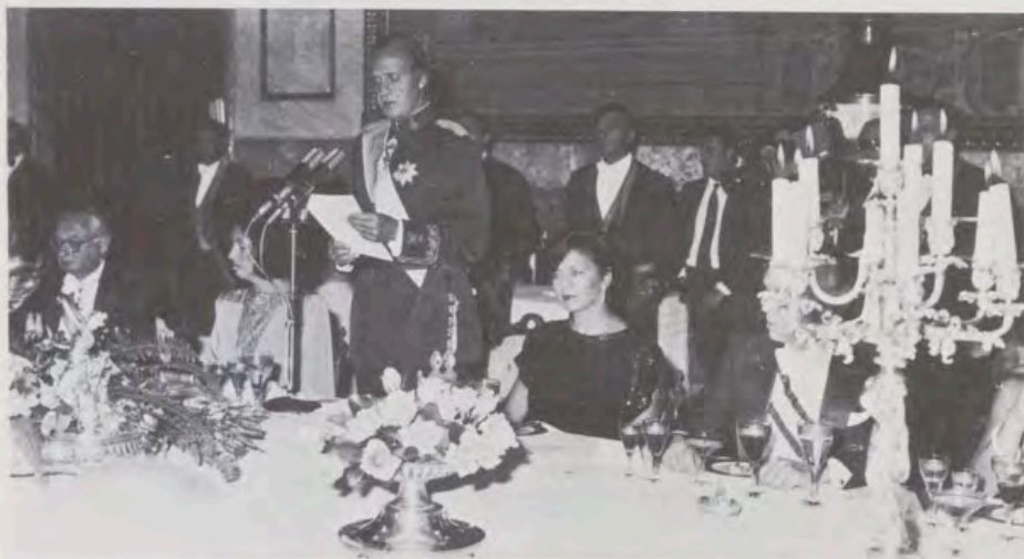
Don Juan Carlos, durante las palabras que pronunció en la cena en honor del Presidente de Grecia.

Por último, el Presidente griego declaró su confianza personal en «el gran papel que puede desarrollar Europa para fortalecer la paz internacional, reimpulsar la democracia y el resurgimiento cultural».