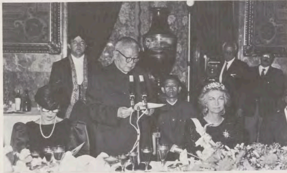
Li Xiannian, durante la alocución que pronunció en respuesta a las palabras del Soberano español.