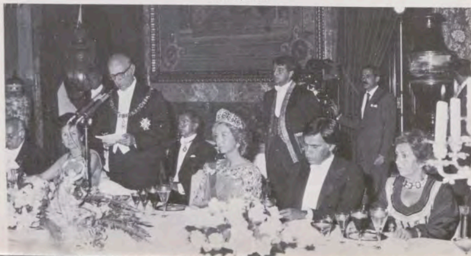
El Presidente griego, en un momento del discurso que pronunció en respuesta a las palabras del Monarca español.