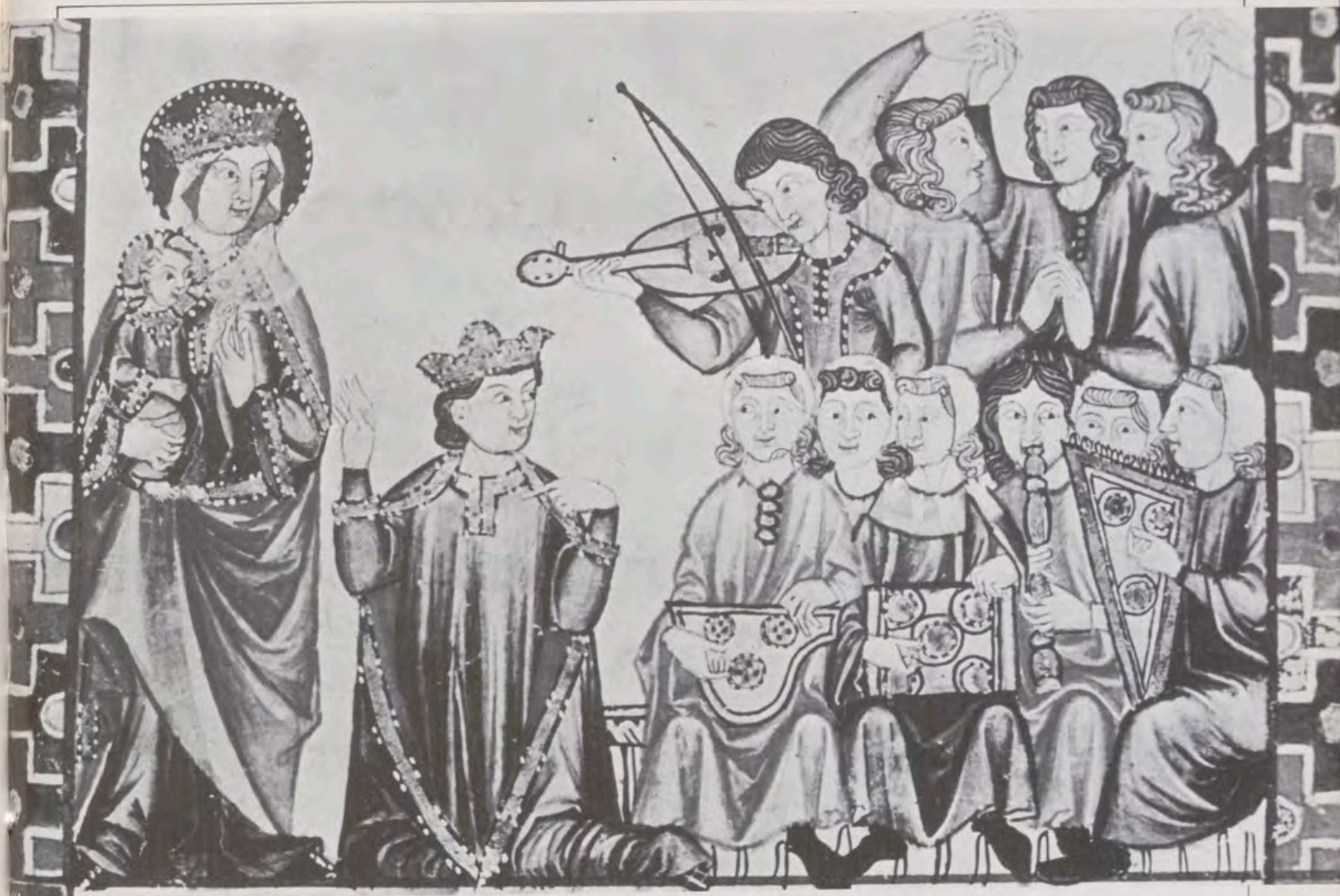
El Rey Alfonso X recita ante la propia Virgen, acompañado por músicos y danzantes. Cantigas de Santa María (Monasterio de El Escorial).