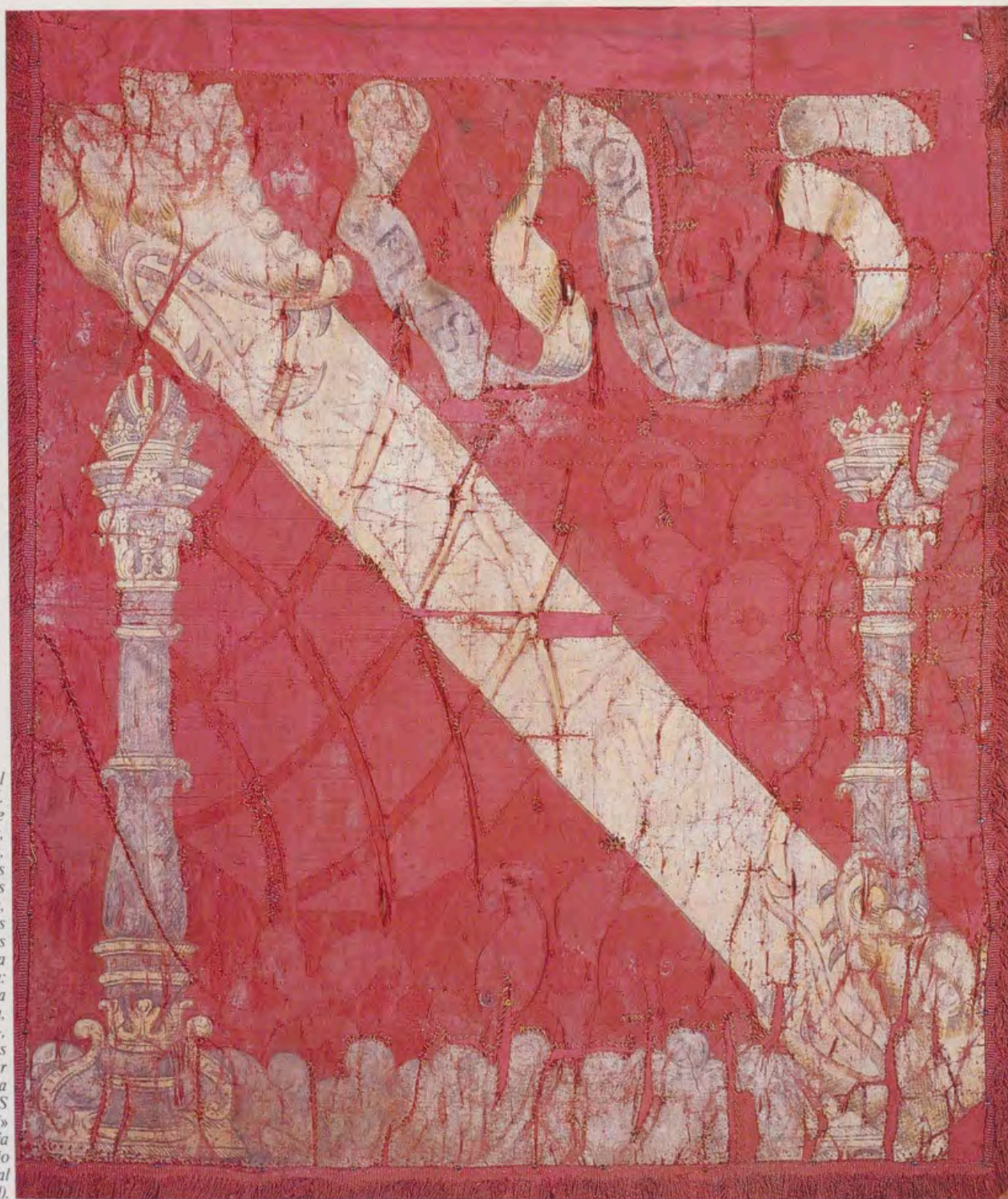
Banda Real de Carlos I. Además de los tragantes, lleva, como insignias propias del Monarca, las Columnas de Hércules —con la corona imperial, una: y la corona abierta, otra—, las aguas del mar y la empresa «PLVS OVLTRE» (Armería del Palacio Real de Madrid).

de las tropas o al sol y los aires que la hayan batido en lo alto de un mástil.