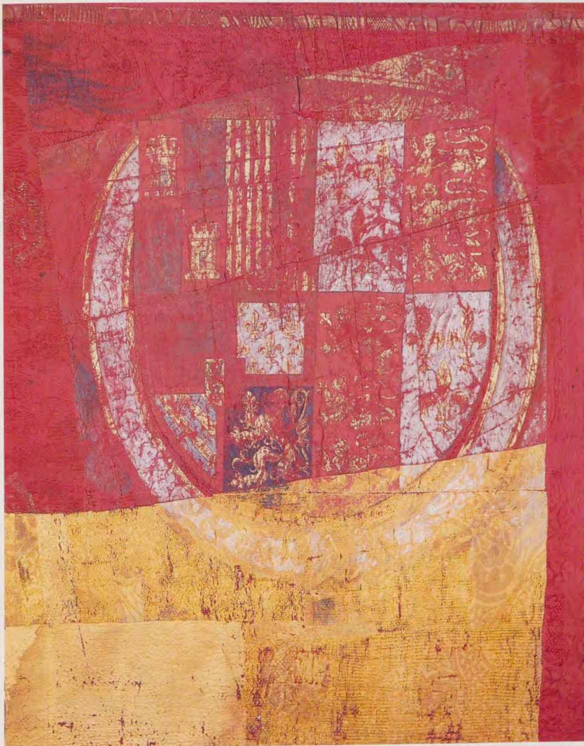
Bandera del futuro Felipe II como Rey consorte de Inglaterra. De la pieza original sólo se conservan tres trozos expuestos en diferentes cuadros. El más representativo es éste, en el que figuran reunidas las armas de los dos reinos (Armería del Palacio Real de Madrid).

señas de todas las naciones, regiones o puertos que las tenían reconocidas. Tiene ejemplares inéditos como la bandera de Barcelona, azul intenso, con la figura del obispo San Telmo en hábito de dominico, o la particular interpretación del escudo de la del Rey de España.