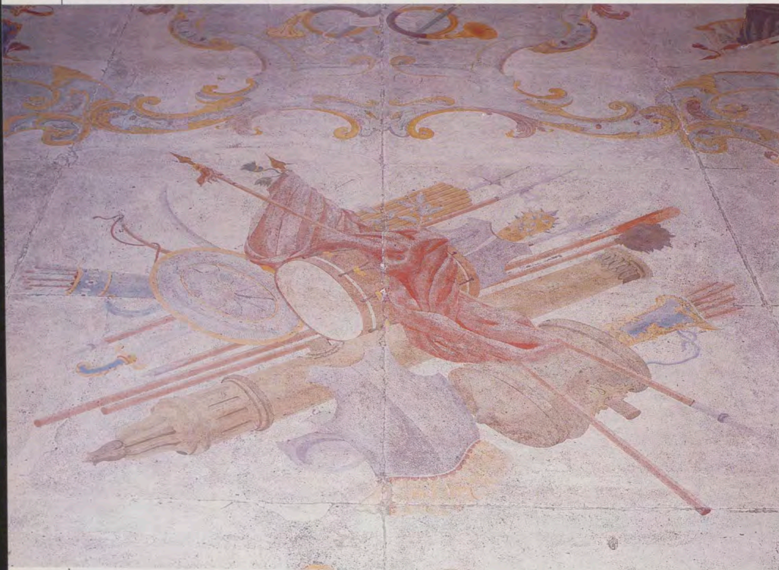
Detalle del suelo del Comedor de Gala del Palacio Real de Aranjuez, en el que se aprecia un trofeo con banderas y armas, que se repite en numerosas ocasiones.

zas de las que la posteridad no puede prescindir.