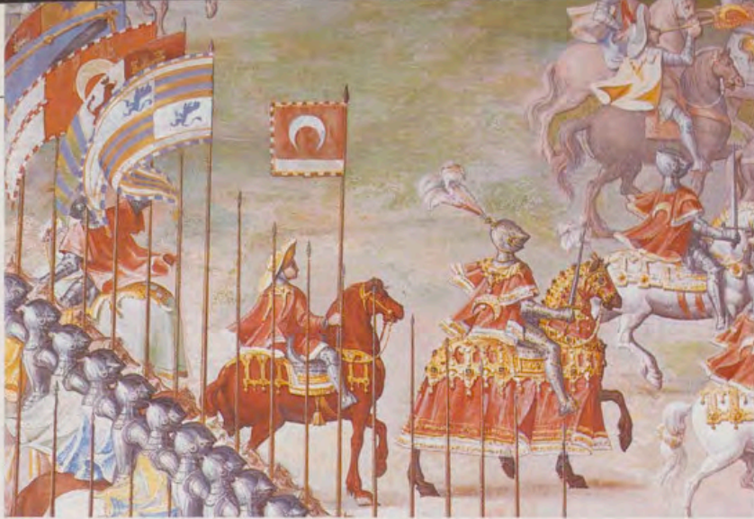
1. Fragmento de la batalla de la Higuera. En el centro se ve a don Alvaro de Luna, detrás su estandarte, y en la fila siguiente banderas de caballeros (Sala de Batallas del Monasterio de El Escorial).