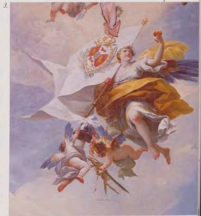
3. Fresco de Maella que representa la victoria de Granada, aunque el escudo de la bandera que lleva el ángel corresponde al reinado de Carlos IV (Casita del Príncipe de El Escorial).

da engolada por dos sierpes o dragones tragantes a las que se añadió, como símbolo personal de monarca, las columnas coronadas, las ondas del mar, que por España dejó de ser tenebroso, y la leyenda «PLVS OVLTRE».