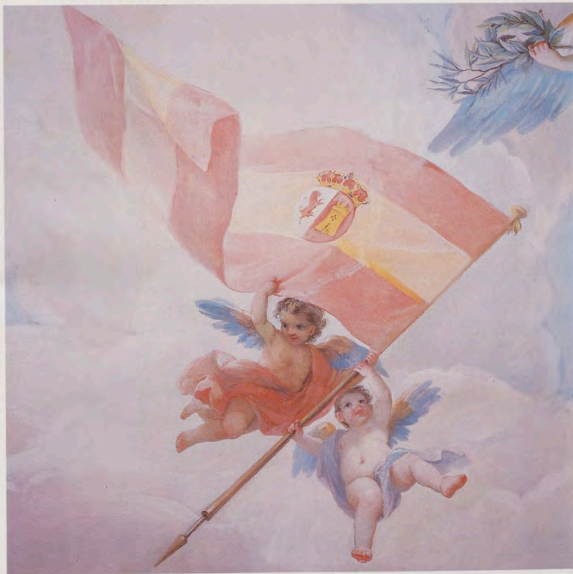
Fresco de Maella con la apoteosis de la Bandera Nacional, elevada al cielo por una pareja de ángeles (Salón de Baile de la Casa del Labrador de Aranjuez).

La Bandera es el símbolo de la Patria inmortal. Así lo recuerdan las Reales Ordenanzas del Ejército actualmente en vigor 1 . Si, como dijo don Serafín María de Sotto, Conde de Clonard 2 , «las grandes masas nunca comprenden bien las ideas abstractas, ni muchas veces los sentimientos más positivos, pero muestran un apego invencible a los símbolos que las representan», nos encontramos con la razón que es principio y fin de la total identificación que existe de la idea de Patria con su más genuina imagen, la Bandera.