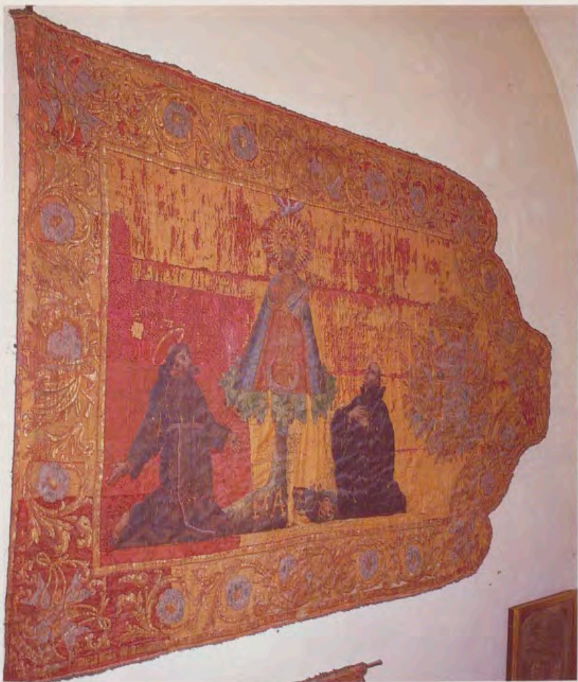
2. Estandarte Naval con Nuestra Señora en el centro y, a sus pies, los dos San Franciscos —el de Asís y el de Borja—. En el batiente, el escudo nobiliario de la familia Arias-Dávila (Armería del Palacio Real de Madrid).