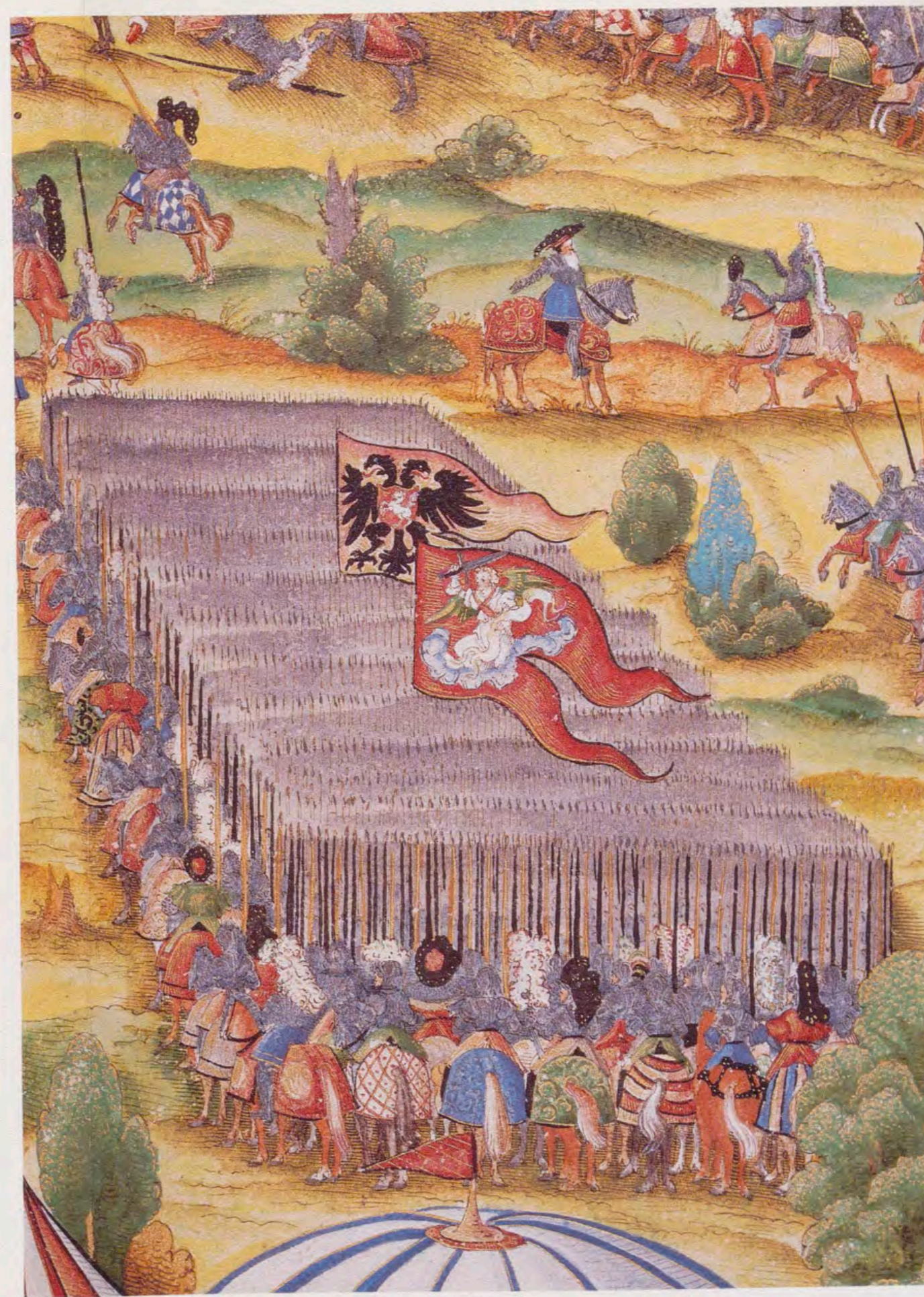
Detalle de la batalla de Viena, en el que aparecen dos estandartes: uno, con San Miguel Arcángel; y otro, de un personaje de la nobleza (Libro de Heráldica General y origen de la nobleza de los Austrias. Biblioteca del Monasterio de El Escorial).