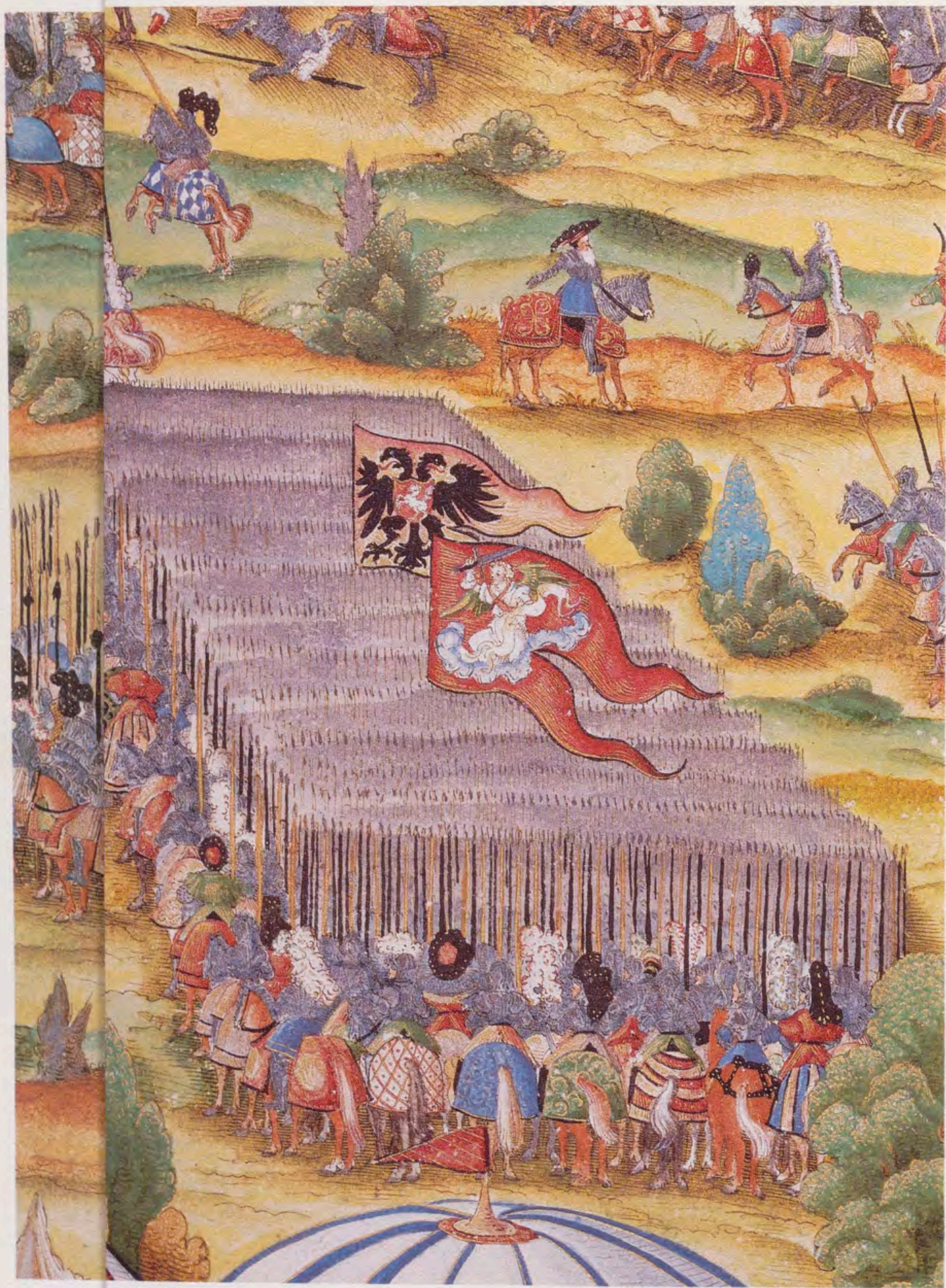
Fragmento de la batalla de Viena, en el que aparecen dos estandartes: uno, con la San Miguel Arcángel; y otro, de un personaje de la nobleza (Libro de Heráldica General y origen de de la nobleza de los Austrias. Biblioteca del Monasterio de El Escorial).