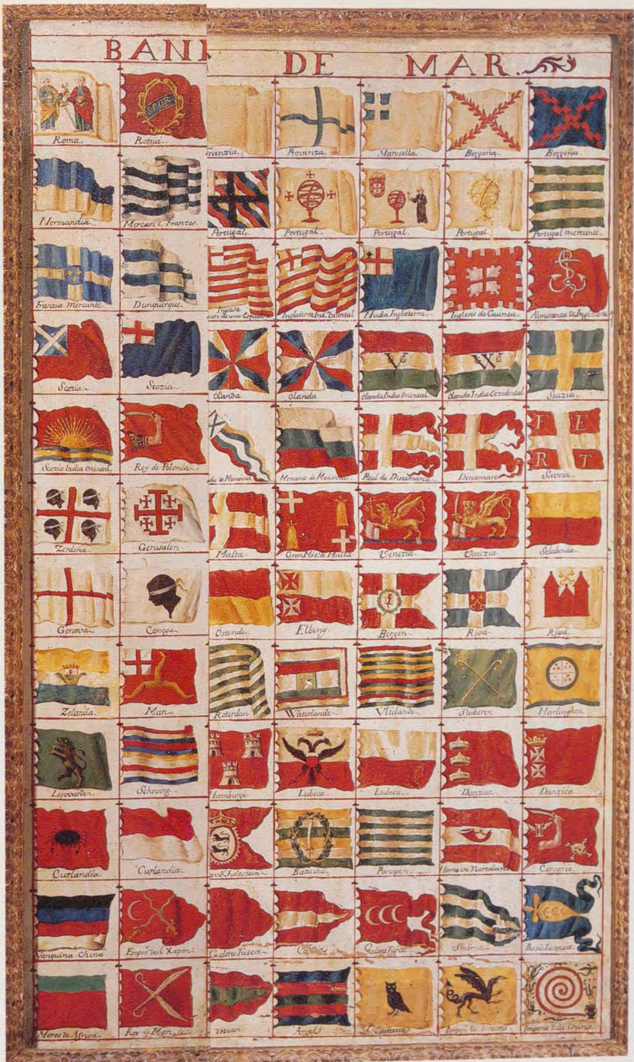
Banderas o pabellones generales de mar azul con la imagen de San Telmo, que