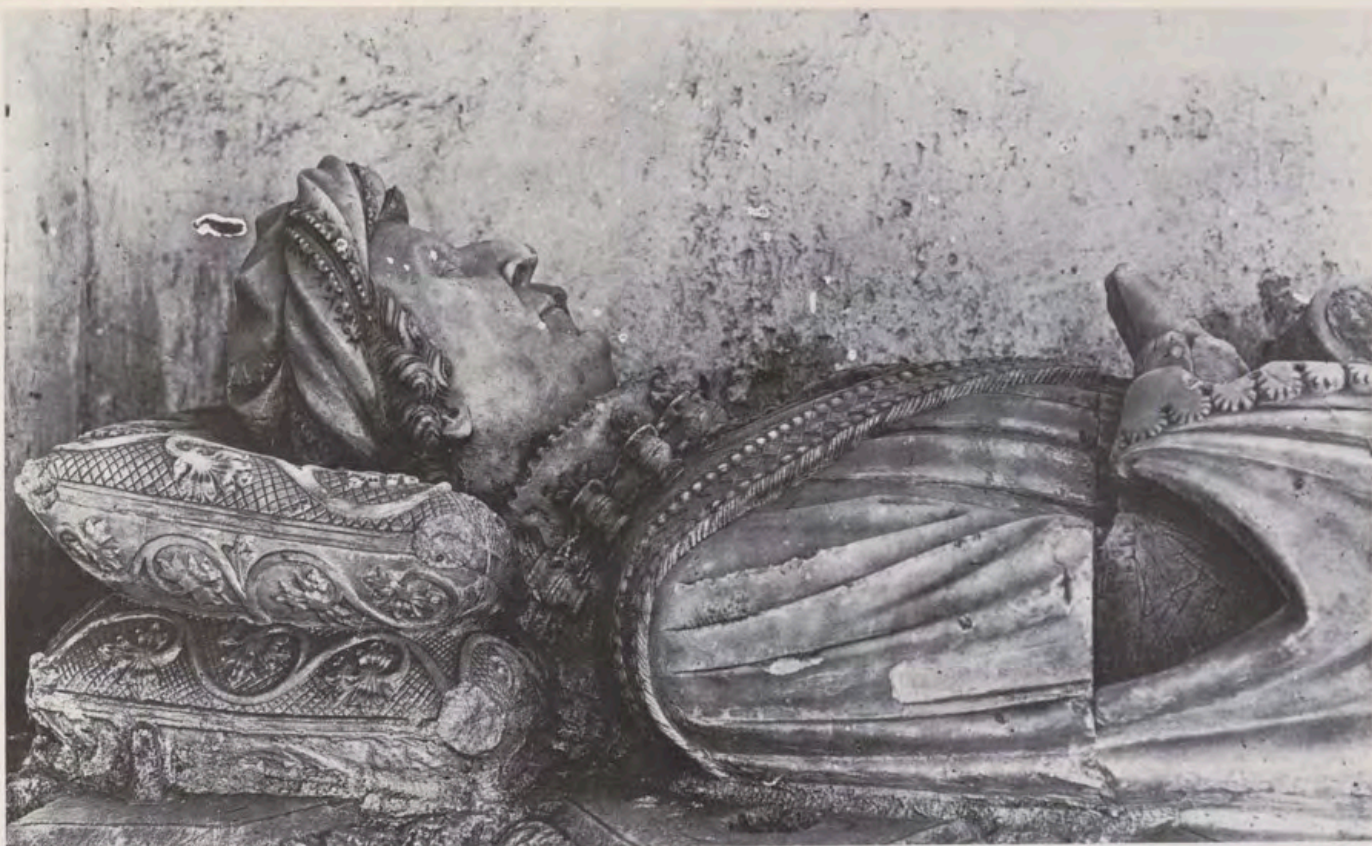
Detalle de la parte superior del sepulcro de Gómez Manrique.