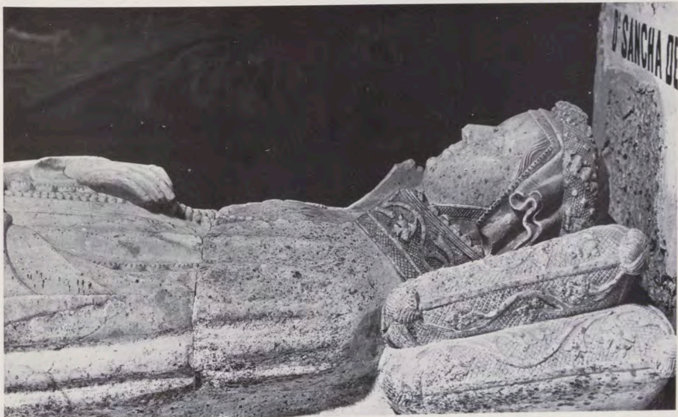
Aspecto de la parte superior del sepulcro de Sancha de Rojas.

tan acusado como el del Adelantado 17 , presenta los ojos abiertos y un aspecto de gran serenidad.