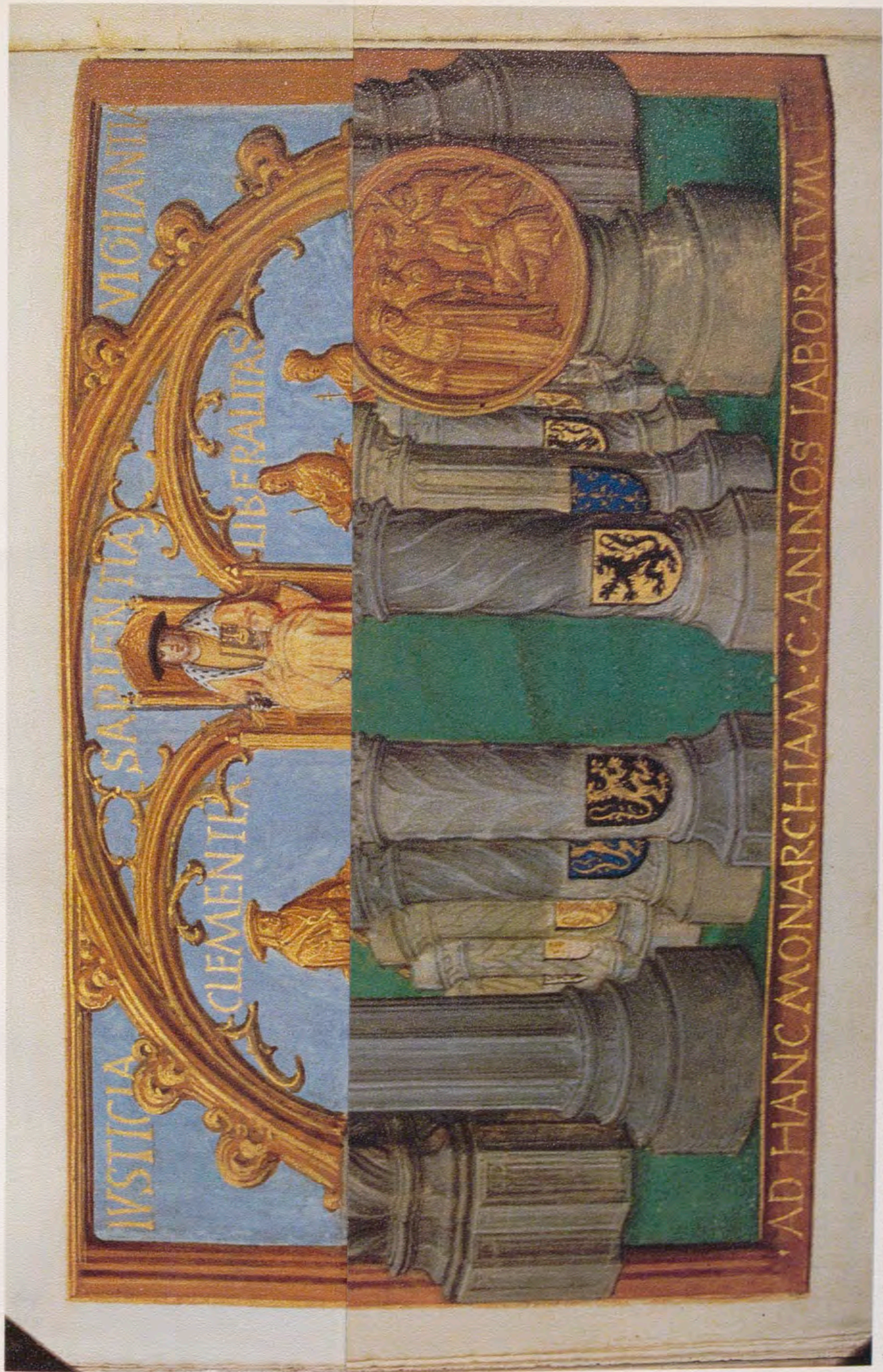
Apoteosis de Carlos V. «Officium Salomonis» (f. 22v del códice Vit. 13 de la Biblioteca del Monasterio de El Escorial).