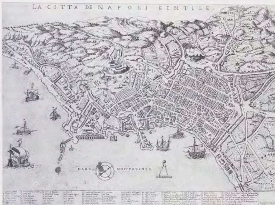
Claudio Ducheti, La città de Napoli gentile, Roma, 1585. Real Biblioteca, IX-Mesa-113 (163).

Veinte legajos de diuersas copias de cartas y villetes de curiosidad que tra-