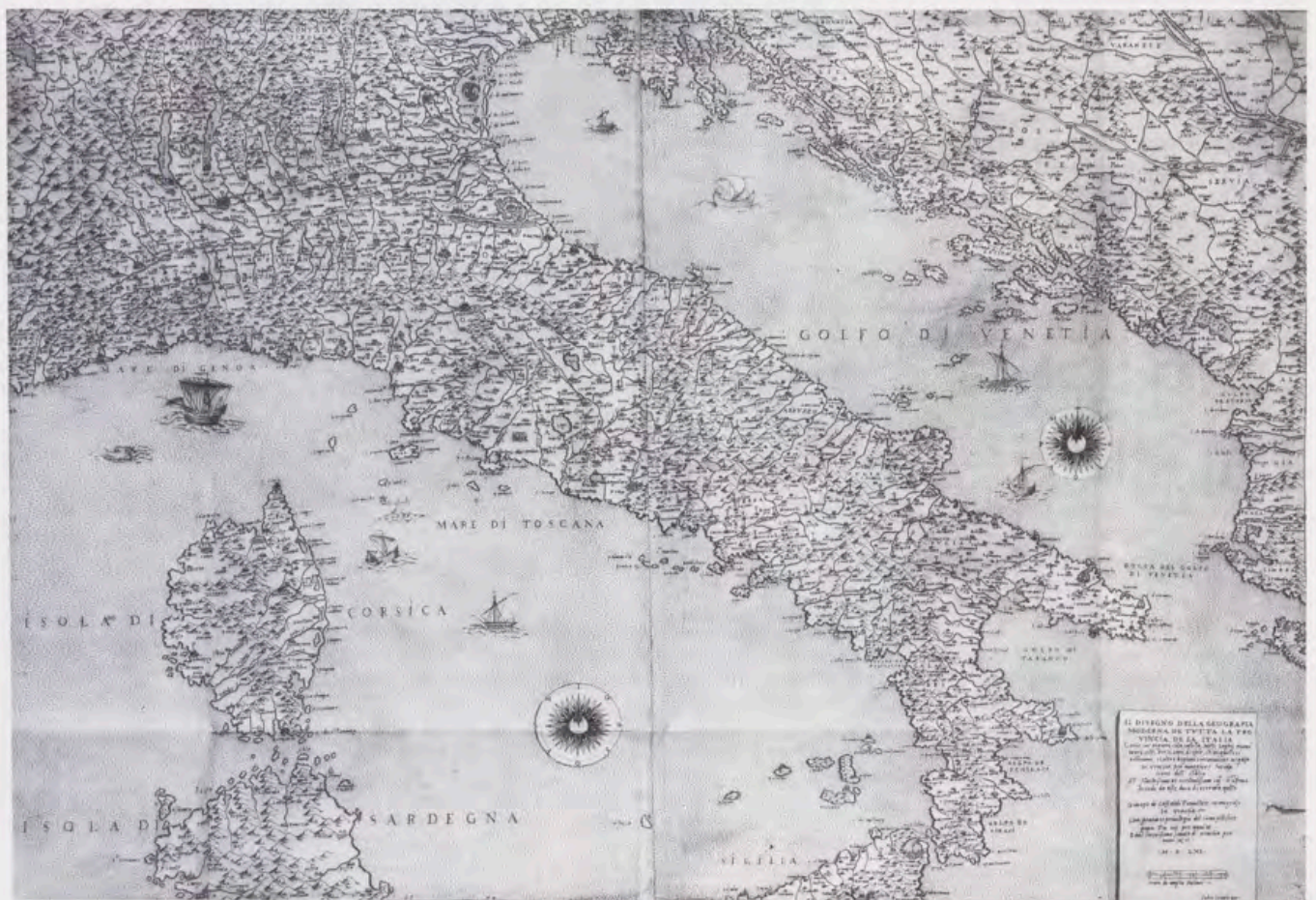
Giacopo di Castaldi, Il disegno della geografia moderna di tutta la provincia dela Italia, Venecia, 1561. Real Biblioteca, Map. 438.

Segundo caxón. Un legajo grande de las cartas que Don Juan mi señor escriuió al marqués de ayamonte desde Roma desde el año de