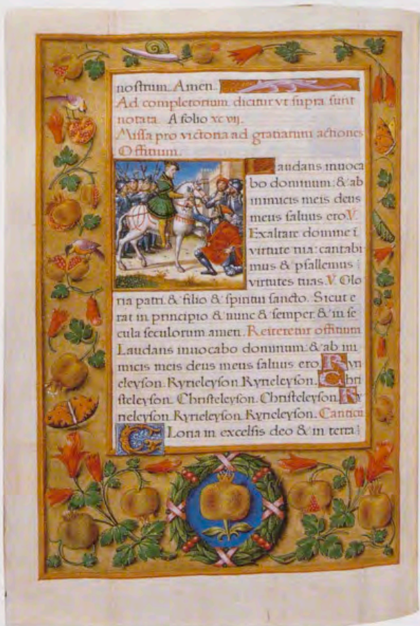
Breviario de Carlos V, tomo I, vitrina 4, fol. 165v.