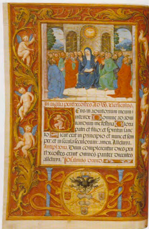
Breviario de Carlos V, tomo III, vitrina 6, fol. 15v.

15 Las dimensiones exactas son: t. I (vit. 4): 294 x 207 mm (folio), 302