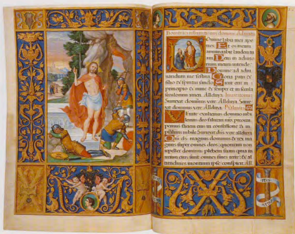
Breviario de Carlos V, tomo II, vitrina 5, fols. 170v. y 171.

San Jerónimo y San Agustín en la parte superior y David y Melquisedec, en la inferior, junto con dos bustos romboidales en los laterales sin identificar. En el folio siguiente una orla Gante-Brujas y una viñeta con dos ángeles que flanquean una custodia, en consonancia con la fundación de la Eucaristía que supuso la Última Cena.