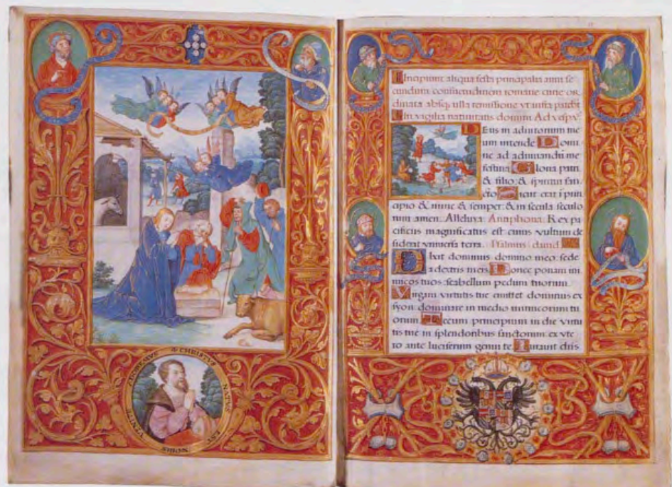
Breviario de Carlos V, tomo I, vitrina 4, fols. 1v. y 2.

A pesar de haber sido conocido tradicionalmente como breviario, sus textos no siguen la estructura habitual de este tipo de libro litúrgico, que, junto con los libros de horas, fue el libro de rezos más extendido entre los seglares en los siglos XV y XVI. Así, Isabel la Católica había poseído importantes brevia-