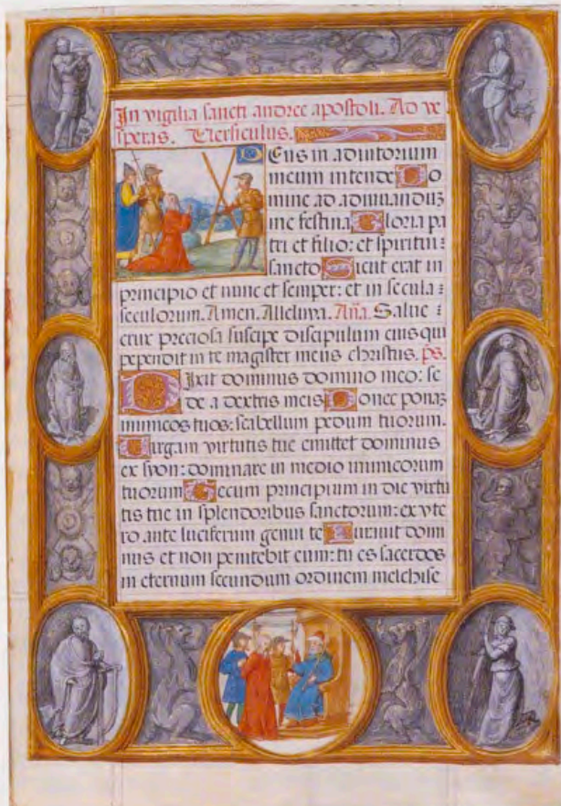
Breviario de Carlos V, tomo IV, vitrina 7, fol. 119.

no se restringió a estas ciudades, con las decoraciones renacentistas de candelieri y grutescos. Este eclecticismo se había extendido en la miniatura toledana desde comienzos de siglo ( Misal Rico de Cisneros , Privilegios de Mayorazgo del marquesado de Villena ), desbancando a las tradicionales decoraciones góticas de roleos sobre el color natural del pergamino. La decoración Gante-Brujas permitía además enriquecer las orlas con contenidos iconográficos, simplemente sustituyendo los elementos vegetales por objetos significativos. Así, encontramos varios folios cuajados con los emblemas imperiales (columnas de Hércules, filacterias con el PLUS-ULTRA, tiaras, escudos) acompañados por los emblemas de la Orden del Toisón de Oro (cruz de San Andrés, fusils ). Otras aluden al contenido del texto, como la orla del fol. 124 v. del primer tomo decorada con veneras, conchas e insignias santiaguistas, que acompaña al comienzo del oficio de la traslación de Santiago Apóstol; o el fol. 165 v. del mismo tomo decorado con granadas, que marca el comienzo del oficio de las gracias por la toma de Granada. Los colores de fondo son variados: amarillos, azules, verdes, etc., pero destaca sobre todo la abundancia del rojo, alusivo quizá a la púrpura como color propio de la dignidad imperial.