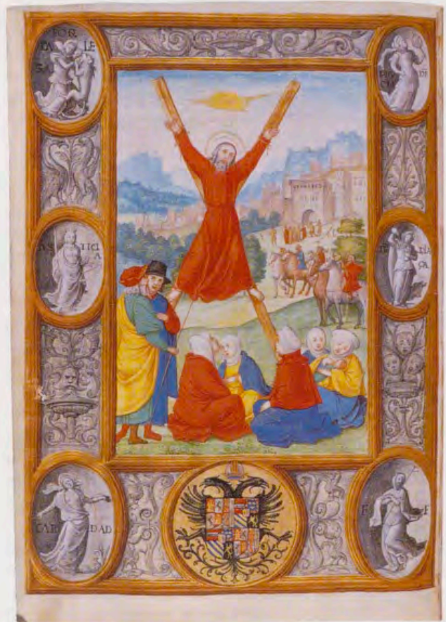
Breviario de Carlos V, tomo IV, vitrina 7, fol. 118v.

Por último, hay que mencionar la abundante decoración no figurada, compuesta por numerosas iniciales y, sobre todo, por una espléndida sucesión de ciento cincuenta y cuatro orlas que señalan el comienzo de las distintas partes de los textos litúrgicos. Las más importantes rodean todo el texto y acompañan a viñetas, iniciales o miniaturas a página completa, mientras que las más sencillas se limitan al margen izquierdo del folio. Son orlas en las que conviven sin problema las decoraciones flamencas de frutas y flores en trampantojo sobre una superficie coloreada, conocidas como orlas Gante-Brujas aunque su uso