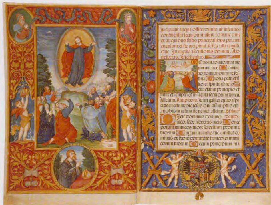
Breviario de Carlos V, tomo III, vitrina 6, fols. 1v. y 2.