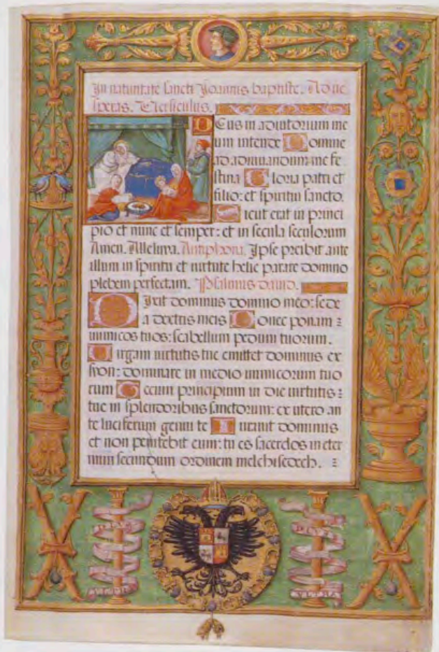
Breviario de Carlos V, tomo IV, vitrina 7, fol. 2.

En el primer tomo encontramos nuevas modalidades de retratos, en las que el Emperador se encarna en personajes religiosos o históricos. Así, ya mencionamos que en el fol. 185 v., y en el marco de una Epifanía , Carlos V aparece representado como uno de los Reyes Magos. La identificación de estos con los monarcas reinantes era habitual desde el siglo XV y el Emperador la asumió en diversas ocasiones 40 . Por otra parte en el fol. 165 v. del primer tomo la viñeta ilustra el "Oficio de las gracias por la victoria de granada" con la figura de Fernando el Católico con los rasgos del Emperador que recibe las llaves de la ciudad. Carlos, al encarnarse en la figura de su abuelo materno, se convierte en el continuador dinástico de su lucha contra los musulmanes. Si el Rey Fernando se había encargado de expulsarlos de la Península será ahora su nieto el que intentará arrojarlos de la cuenca mediterránea. Esta idea sucesoria quedará formulada en la obra de Giangiorgio Trissino La Italia liberata da gothi (1547-1548) 41 .