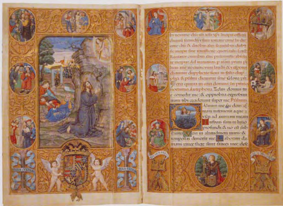
Breviario de Carlos V, tomo II, vitrina 5, fols. 1v. y 2, Biblioteca del Real Monasterio de El Escorial.

En la construcción predominan los fascículos de ocho folios (cuaterniones), que fue el modelo más habitual en la confección de manuscritos 16 . Unos tomos muestran mayor regularidad que otros, aunque todos siguen el principio de Gregory, según el cual los fascículos se organizan de manera que siempre coinciden los mismos lados del pergamino, carne o pelo, cuando el códice está abierto. Los tomos I, III y IV llevan una numeración en romanos coetánea del códice, mientras que el segundo lleva una numeración en arábigos posterior. Abundan los reclamos verticales, y pueden verse restos de signaturas tipográficas en el tomo II, así como de punzados en el tomo III. Las armoniosas proporciones de la caja de escritura no son fruto de la casualidad sino que responden a un cuidadoso estudio. En efecto, describen un rectángulo trazado a partir de la fórmula “ a \times a\sqrt{2} ”, es decir aquél